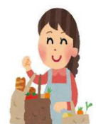
買い物、薬の受け取り