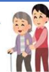
移動などの 生活動作の介助