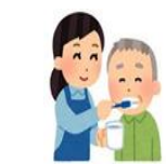
身体整容・ 洗面の介助