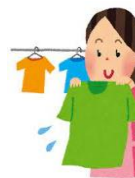
洗濯・生活環境を 整える