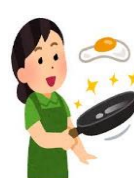
一般的な食事の準備や調理